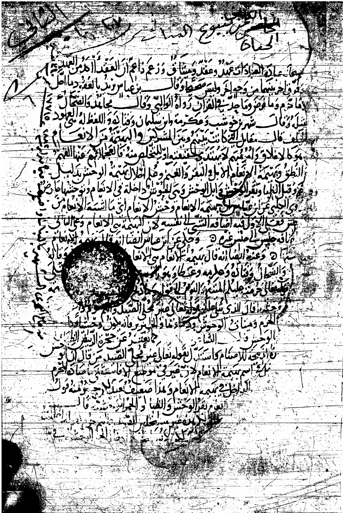
صورة من غلاف نسخة دار الكتب المصرية (الجزء الثاني)